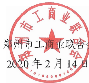
郑州市工商业联合会 2020年2月14日