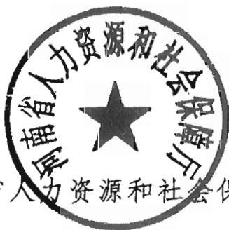
河南省人力资源和社会保障厅

附件：人力资源社会保障部全国总工会中国企业联合会/中国企业家协会全国工商联关于做好新型冠状病毒感染肺炎疫情防控期间稳定劳动关系支持企业复工复产的意见（人社部发〔2020〕8号）